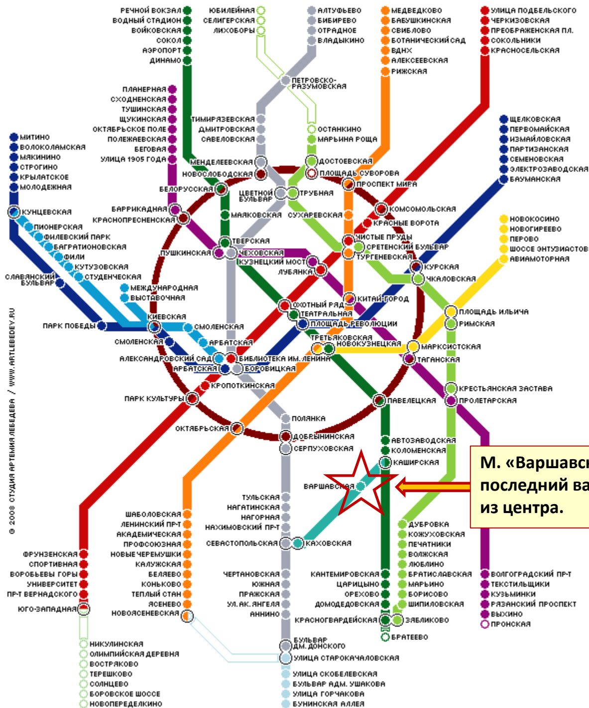
СХЕМА ЛИНИЙ МОСКОВСКОГО МЕТРОПОЛИТЕНА

М. «Варшавская», последний вагон из центра.